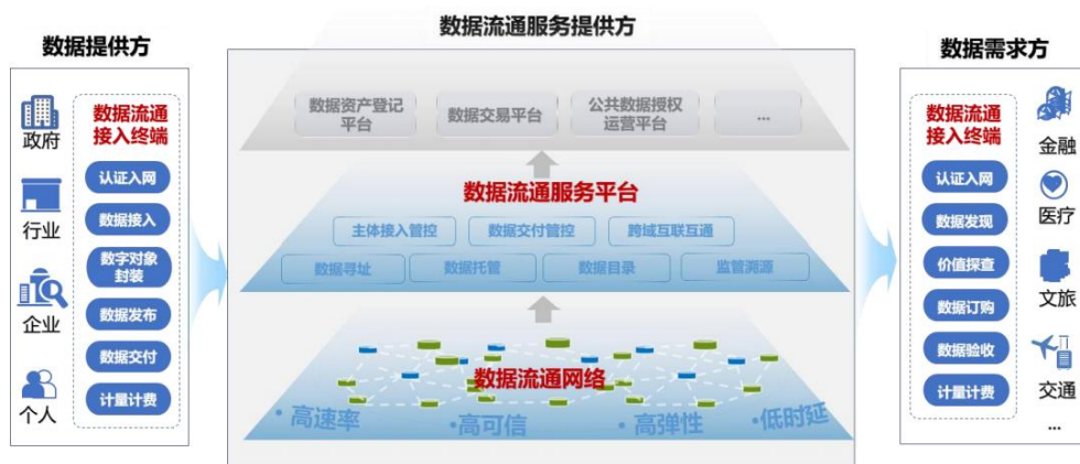
图 4 数联网功能架构图