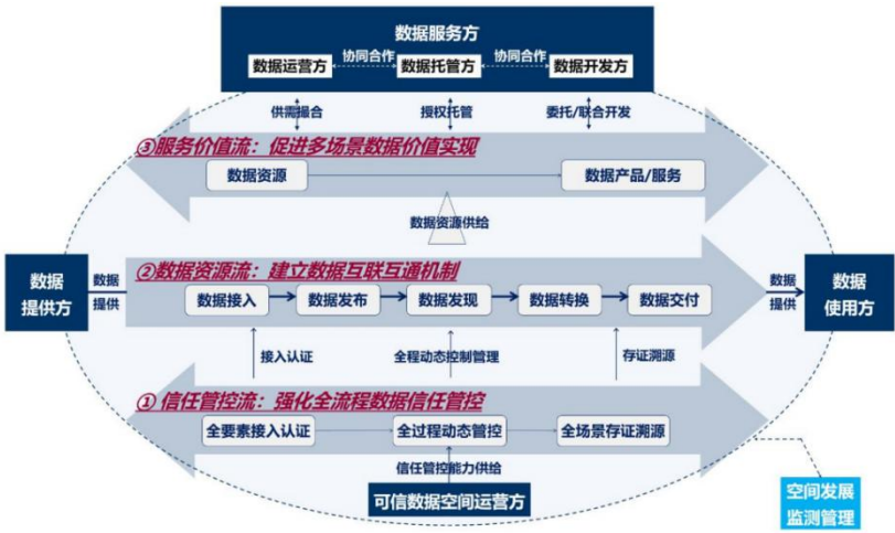
图 2 可信数据空间架构图

可信数据空间是基于共识规则，联接多方主体，实现数据资源共享共用的一种数据流通利用设施，是数据要素价值共创的应用生态，是支撑构建全国一体化数据市场的重要载体。可信数据空间须具备数据可信管控、资源交互、价值共创三类核心能力。